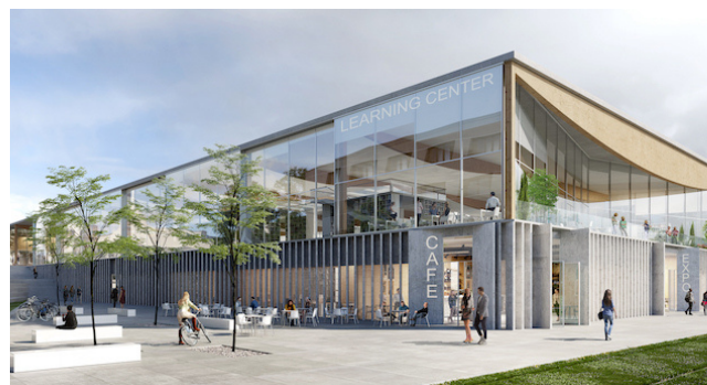
Table ronde : quels services innovants mettre en place dans nos bibliothèques d'IUT ? Échanges autour de projets d'aménagements / de rénovation en cours et à venir.

13h30 | « La Ruche », chantier d'une BU innovante pour l'université LYON II